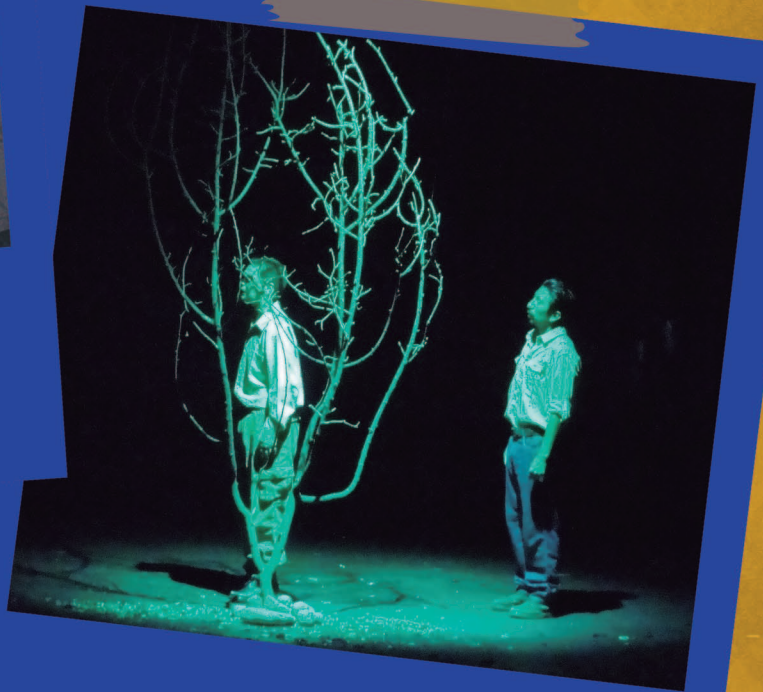
FETCA edición 2013