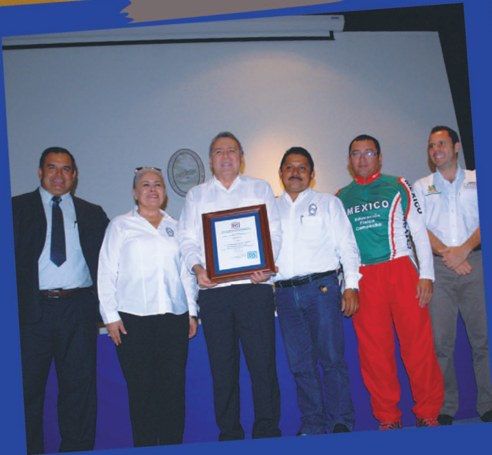
Acreditan el programa educativo de educación física y deporte